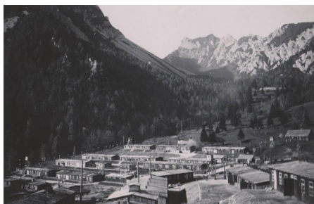
Takratna podoba taborišča

Interniranci so spali na zdrobljeni slami, po dva moža na enem ležišču. Od petih do 5.30 so dobili zajtrk, to je četrta litra mlačne vode in majhen košček kruha. Ob 5.30 je bil apel, kjer so se po vojaško postrojili, največkrat je bil še kdo tepen, nato je sledila razdelitev in odhod na delo, kamor so jih spremljali SS-ovci z ovčjaki. Delali so neprestano od šeste do dvanajste, ko je bil zbor za kosilo. Kappo je delil hrano na ta način, da je moral vsak teči do kotla, počakati na obrok in nato teči naprej, da se je polilo še tisto, kar je dobil. Mnogokrat je kappo iz objestnosti polil hrano po roki, ki je držala porcijo, ali pa poveznil zajemalko s hrano vred jetniku na glavo.